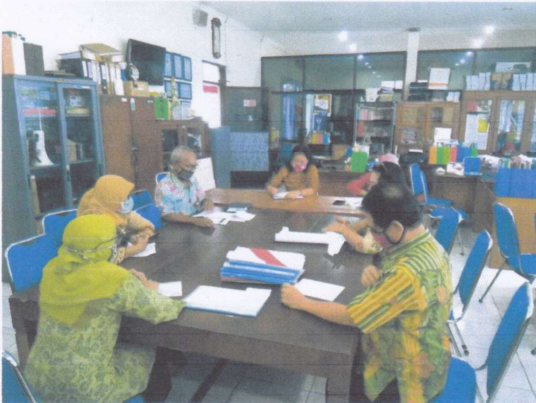
Rapat Pembahasan Rencana Daftar Informasi Publik dan Uji Konsekuensi atas Informasi yang Dikecualikan Tahun 2021