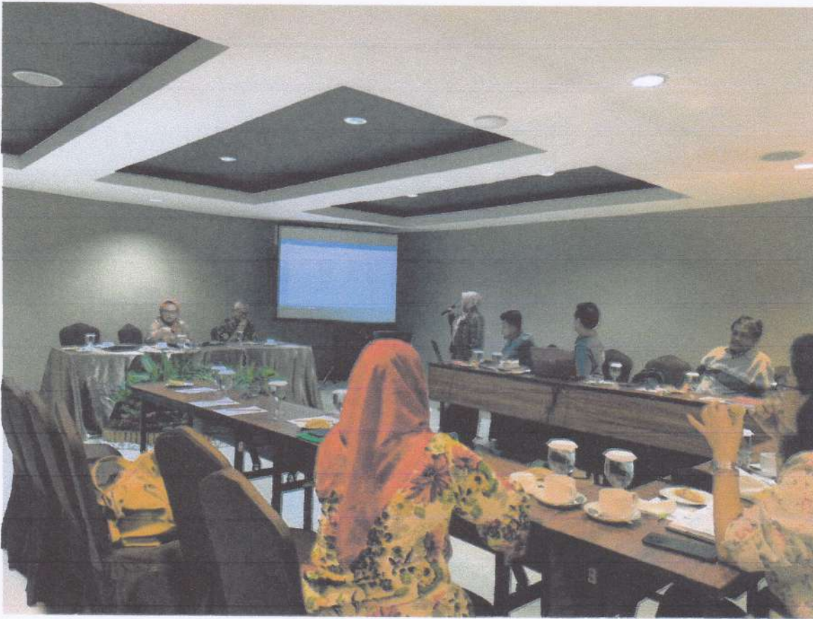
Rapat Pembahasan Penguatan PPID Melalui Peningkatan Kapasitas SDM dan Penyusunan Regulasi sebagai Petunjuk Informasi Tahun 2021